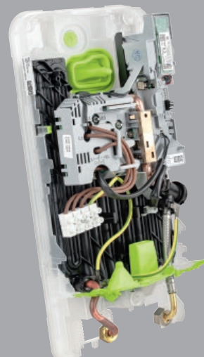
Basisplatte mit Heizsystem