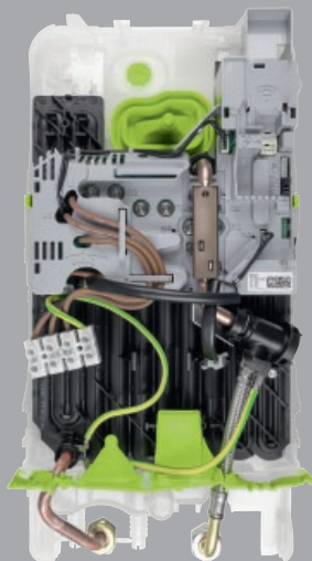
Innenansicht Logamax ED166

Der Logamax ED166 ist nicht nur kostengünstig in der Anschaffung, er spart auch Zeit bei der Montage: Durch seinen Aufbau lässt er sich leicht, schnell und sauber installieren. Außerdem arbeitet er besonders hygienisch: Die Warmwasserbereitung erfolgt im Durchflussprinzip, was die Bildung von Bakterien mindert. Dadurch entfällt die Untersuchungspflicht auf Legionellen, die die Trinkwasserverordnung (TrinkwV) vorschreibt, in den meisten Fällen. Der Durchlauferhitzer lässt sich problemlos in eine Systemlösung mit Wärmepumpe und Solaranlage integrieren. Über ein optionales Internet-Gateway ist er internetfähig und kann komfortabel über die App MyBuderus per Smartphone bedient werden. Das macht den Logamax ED166 extrem effizient und unkompliziert zu bedienen. Die Energie- und Wasserkosten können exakt zugeordnet und optimiert werden. Die hohe Qualität der verbauten Materialien sorgt zudem für Robustheit und eine lange Lebensdauer.