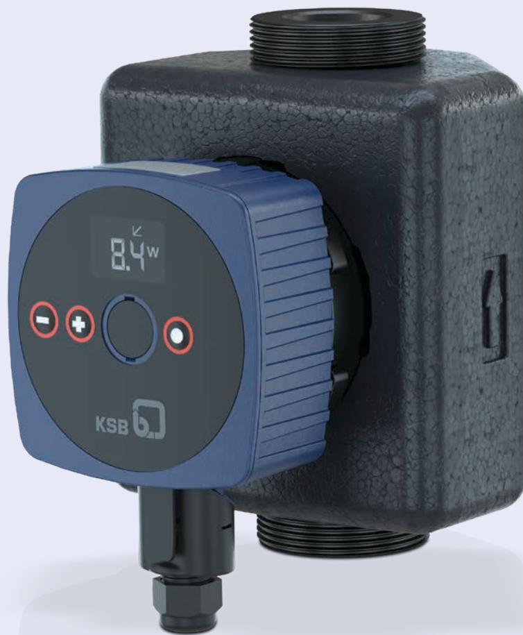
Calio S Pro mit Dämmschale