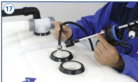
Auftriebskörper und Saugschlauch der Entnahmeerweiterungseinheit in den Tank einlassen.