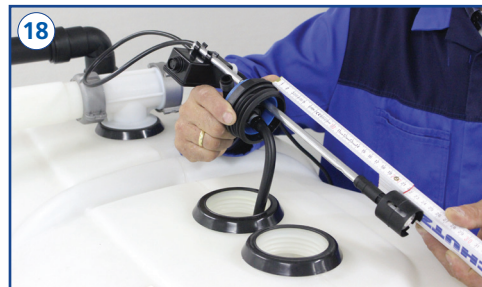
Einstellung (x-Maß) des Schwimmerschalters gemäß beiliegender Beschreibung vornehmen.