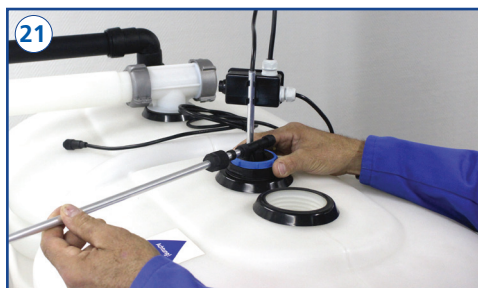
Verbindungsleitung mit aufgesteckter Überwurfmutter und Dichtung in den längeren Schenkel der Entnahmeerweiterungseinheit einführen und rechtwinklig zum Tank ausrichten.