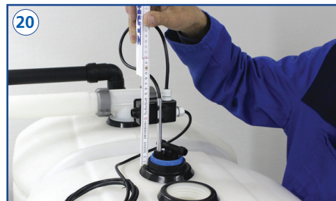
Entnahmeerweiterungseinheit in den Tank fest einschrauben und Schwimmerschaltereinstellung (y-Maß) kontrollieren.