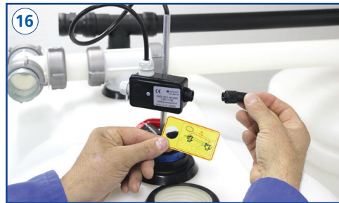
Abschlußstecker der Überfüllsicherung gemäß Anhängeschild lösen und später am letzten Tank montieren.