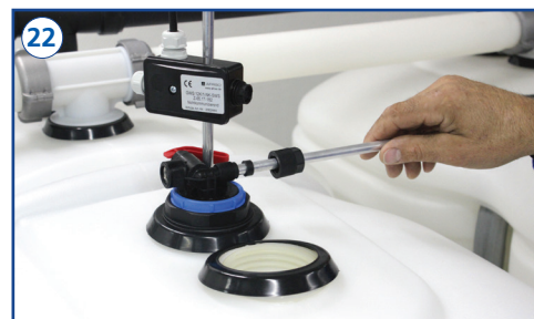
Verbindungsleitung in die Entnahmeerweiterungseinheit einführen.