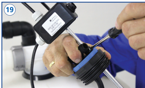
Eingestelltes Schwimmerschalter-Maß mit der Schraube fixieren.