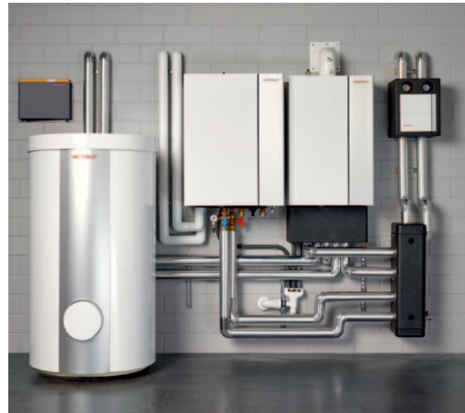
Hybridsystem Wärmepumpe mit Gasbrennwertgerät

Während ein Neubau oder ein Bestandsgebäude mit Fußbodenheizung ideal für die alleinige Beheizung mit einer Wärmepumpe geeignet ist, bietet die Kombination eines Weishaupt Gas-Brennwertgerätes mit einer Weishaupt Wärmepumpe den Vorteil, auch ohne Flächenheizungen den Großteil der Jahresheizarbeit über die Wärmepumpe äußerst wirtschaftlich abzudecken. Bei extrem niedrigen Außentemperaturen oder für die Wassererwärmung übernimmt automatisch das Gas-Brennwertgerät die Wärmeproduktion.